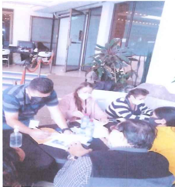
Generación de documentos de expedientes en CCMAA

Se apoyó a los maestros a generar su constancia de inventario de cuentas, se verificó que el Documento Único de Identificación no estuviese vencido, se verificó el período (2021) correcto de los timbres fiscales, se asistió a los maestros a ordenar e identificar cada una de sus fotografías presentadas y llevar el sentido cronológico de las mismas en su portafolio.