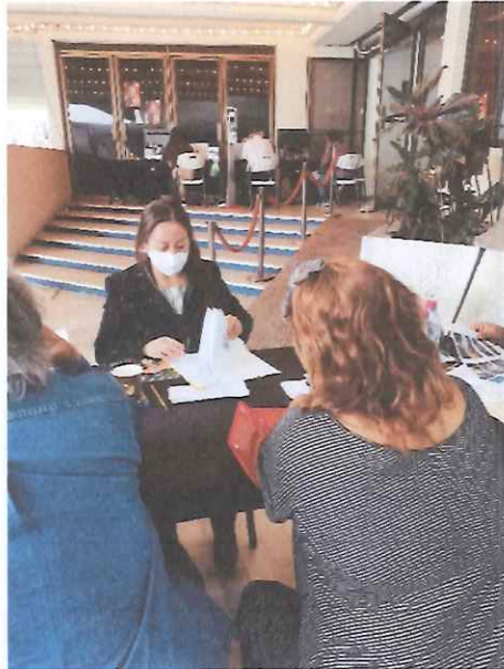
Traslado de documentos en CCMAA

Luego de conformados los expedientes se trasladaron para su adecuado resguardo