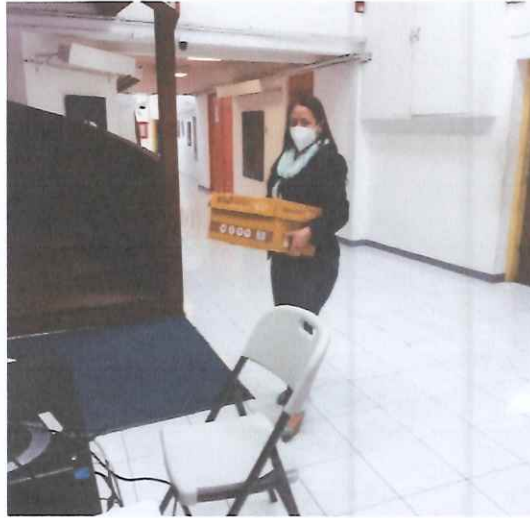
Resguardo de documentos en CCMAA

Se apoyó en el resguardo de equipo de cómputo y útiles de oficina, colocándolos al finalizar la semana laboral en la oficina dispuesta para tal fin, en el Centro Cultural Miguel Ángel Asturias para su adecuado resguardo.