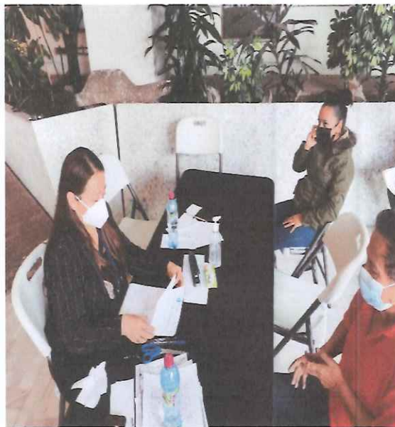
Revisión de expedientes en CCMAA